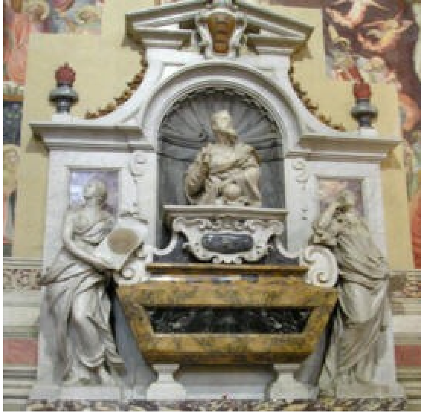
Mormântul lui Galilei

cercetare mai atentă, lucrurile nu se prezintă chiar așa. În primul rând: despre ce reabilitare să fi fost vorba? În urma abjurării, Galilei s-a pocăit în scris și a fost iertat încă de pe atunci , el ca persoană, de către biserica catolică. Dovada cea mai zdrobitoare în acest sens este faptul că el este înmormântat în biserica Basilica di Santa Croce din Florența!